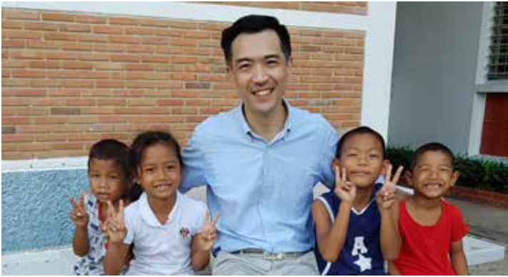
เรียน ท่านผู้มีจิตเมตตา

ท่ามกลางสถานการณ์ต่างๆ ที่เปลี่ยนแปลงไปอย่างรวดเร็ว ทั้งการแพร่ระบาดของโรคโควิด-19 ปัญหาสภาวะเศรษฐกิจที่ทำนาย ปัญหาสังคมไทยในปัจจุบัน เสียงร้องของเด็กที่ถูกทอดทิ้ง อาจจะไม่ดังพอที่จะทำให้ใครสนใจ และความรู้สึกของเด็กๆ ที่กำลังมีปัญหา อาจจะถูกปฏิเสธหรือมองข้าม ซึ่งจะก่อให้เกิดเป็นปัญหาสังคมตามมา ดังนั้นการรับฟัง ให้ความช่วยเหลือ ทำความเข้าใจ และเคารพในสิทธิของเด็ก จึงถือเป็นสิ่งสำคัญมากที่สุด