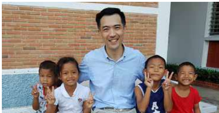
เรียน ท่านผู้มีจิตเมตตา

นับตั้งแต่วันที่มูลนิธิเด็กโสสะแห่งประเทศไทยฯ ได้เริ่มก่อตั้งขึ้นเมื่อ 51 ปีที่แล้ว จนถึงวันนี้ มีเด็กยากไร้สูญเสียบิดามารดา ขาดญาติมิตร ที่ได้รับการเลี้ยงดูจากครอบครัวโสสะ จนเติบโตเป็นผู้ใหญ่ ออกไปประกอบอาชีพเลี้ยงดูตัวเองในสังคม ได้แล้วมากกว่า 500 คน และในปัจจุบันยังมีเด็กอีกกว่า 700 ชีวิต ที่อยู่ในการเลี้ยงดูของครอบครัวโสสะในหมู่บ้านเด็กโสสะทั้ง 5 แห่งทั่วประเทศได้แก่ บางปู สมุทรปราการ, หาดใหญ่ สงขลา, หนองคาย, เชียงราย และภูเก็ต