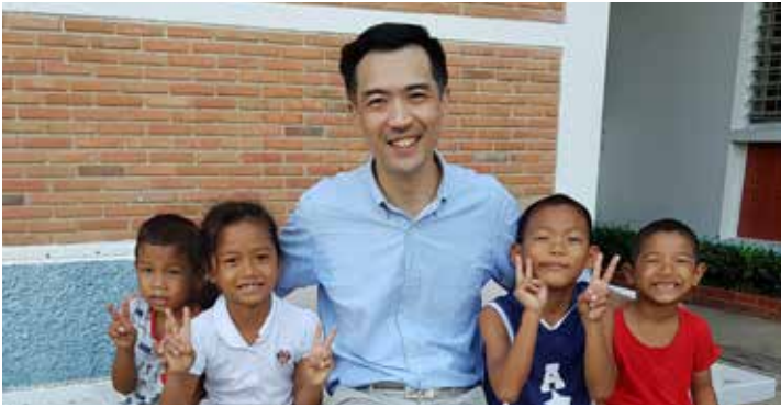
เรียน ท่านผู้มีจิตเมตตา

การแพร่ระบาดของโรคโควิด-19 (COVID-19) ระลอกใหม่ในช่วงที่ผ่านมา ได้มีจำนวนผู้ติดเชื้อภายในประเทศเพิ่มสูงขึ้นมาก ส่งผลให้คนไทยและองค์กรหน่วยงานต่างๆ ต้องเพิ่มความเข้มงวดกับมาตรการป้องกัน และเผชิญกับความยากลำบากกันอย่างมากอีกครั้ง